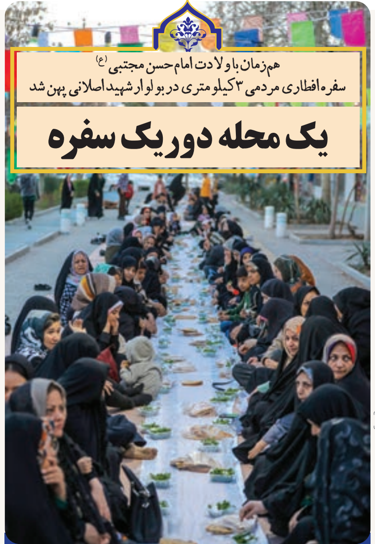
رنگ عکس: حدیث فقیری / شهرآرا

سمیرا منشادی | حال و هوای بولوار شهید اصلانی با همه روزها و حتی شب‌هایی که برای تهیه گزارش به اینجا آمده‌ام، متفاوت است. قرار است سفره افطاری مردمی به طول سه کیلومتر در پیاده‌رو این بولوار گسترده شود تا روزه‌داران برای افطار، سر سفره کریم اهل‌البيت (ع) بنشینند. با آنکه تا اذان حدود دو ساعتی مانده است، عده‌ای از مردم و کسبه دست به دست هم داده‌اند و در حال تهیه و تدارک سفره هستند. هم‌زمان با میلاد کریم اهل‌البيت، امام حسن مجتبی (ع)، این سفره کریمانه حدفاصل خیابان شهید اصلانی ۳۳ تا ۹۹ به همت مردم، هیئت‌های مذهبی، تشکل‌ها و مساجد پهن می‌شود. سفره افطاری ساده‌ای که از پخت و پز سوپیش تا بسته‌بندی نان و پاک کردن سبزی را مردم انجام داده‌اند. البته اجرای برنامه شاد، اجرای سرود، محفل قرآن و برگزاری نماز جماعت هم از جمله برنامه‌های این افطاری ساده است.