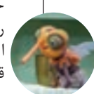
پشه (کارشناس تحکیم بنیان)

خونه فوقش باید چهل متر باشه. همچنین که وقتی یکی از اعضای خانواده می خواد از کنار اون یکی رد بشه، شونه شون بگیره به هم. این طوری که بنیان خانواده قشنگ قرص و محکم، سفت می شه. شب خواستی بخوابی، خوشگل خیاری دراز به دراز آفتی شی کنار هم. ماهم واسه دو مک نوشیدنی زابه راه نمی شیم هی از این اتاق به اون اتاق. ممنون از اعتمادتون.