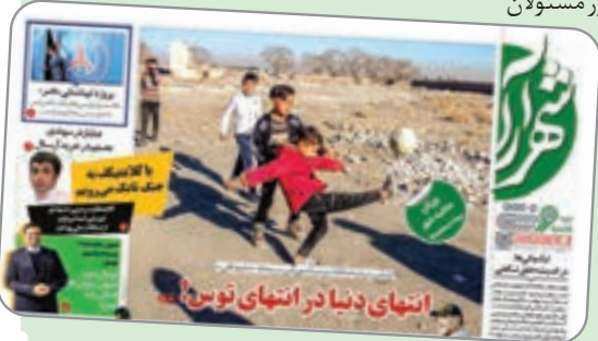
انتهای دنیا در انتهای تو س!

زیرساخت ها منجر شد و گاهی هم تا همین امروز مسئولان حاضر نشدند برای رفع این نواقص سری به آنجا بزنند. با وجود این، در این ۱۰ شماره که در بهار سال ۱۴۰۰ به رشته تحریر درآمد، استقبال چشمگیری از اهالی محلات برای بیان مشکلات ورزش و سرانه های ورزشی در محله شان صورت گرفت. شهرآر ورزشی در آن برهه هر اقدام مثبتی که از سوی دستگاه یا نهادی برای حل این مشکلات صورت می گرفت، در شماره هفته بعد اعلام می کرد که این انگیزه زیادی به مسئولان برای حل و فصل این مشکلات داده بود.