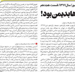
تاریخ نگاری حضور تیم های مشهدی در فوتبال باشگاهی کشور / ۱۳۷۷ قسمت هشتم

تاریخ ورزش مشهد یکی از موضوعاتی است که متأسفانه کمتر به آن پرداخته شده است؛ به طوری که تقریباً هیچ منبع متقن و مشخصی درباره تاریخ ورزش مشهد و رویدادهای مهم آن وجود ندارد. شهر آرزو ورزشی در راستای تلاش برای پر کردن این خلأ، به جز بخش «قاب خاطره»، در قالب دو بخش «تاریخ فوتبال مشهد» و «تقویم تاریخ» تلاش کرده آنچه از تاریخ ورزش این شهر به جای مانده است، ماندگار کند تا هم امکان مجلد شدن داشته باشد و هم به صورت منبعی موثق درآید و برای استفاده آیندگان مفید باشد. نگارش تاریخ فوتبال باشگاهی مشهد از سال ۱۳۲۹ که مشهدی ها وارد این عرصه در کشور شدند، آغاز شده است و تا کنون که به سال ۱۳۷۷ رسیده ایم، نزدیک به دو بیست شماره در این زمینه نوشته شده است تا اولین بار تاریخ فوتبال باشگاهی مشهد به طور دقیق جمع آوری شود؛ کاری ماندگار که به شدت ظرفیت تبدیل شدن به کتاب و حتی فیلم کوتاه و بلند نیز دارد و از همه مهم تر جای خالی این مقوله مهم را برای تاریخ پژوهان ورزش مشهد پر می کند. علاوه بر این، روزهای سه شنبه بریده روزنامه ها و مجله های قدیمی را که درباره ورزش مشهدیاتی تیم های مشهدی نوشته اند، باز تولید می کنیم تا ضمن آشنایی خوانندگان با ادبیات و نحوه نگارش روزنامه نگاران در آن زمان، به صورت مستند و موثق در جریان آن رویداد ورزشی قرار بگیرند.