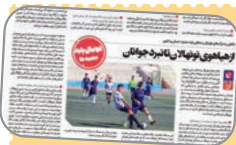
زیرساخت های فوتبال پایه

یکی از سرفصل های مهم کاری شهرآر ورزشی از زمان پیدایش، توجه به ورزش پایه بوده است. شناسایی و معرفی استعداد های ورزشی از یک سو و طرح شبکه مسائل این حوزه از سوی دیگر، دو شاخه اصلی این حوزه است و زیرشاخه های زیادی برای آن تعریف و اجرا کرده ایم. درج نتایج و گل زنان مسابقات فوتبال رده پایه یکی از ابتکاراتی است که با استقبال زیاد نونهالان و خردسالان و خانواده های آنان همراه شده است. علاوه بر این، به طور هفتگی هر چهارشنبه یک ستون ویژه درباره مهم ترین اتفاقات حوزه فوتبال پایه ایجاد شده که به نوعی گزارش خلاصه وار همه رویداد های مهم هفته است. گفت و گو با چهره های ویژه و مؤثر در رده های پایه، از کودکان موفق تا مربیانی که بی ریا در این عرصه فعالیت می کنند، از دیگر کارهایی است که شهرآر ورزشی به آن می بالد.