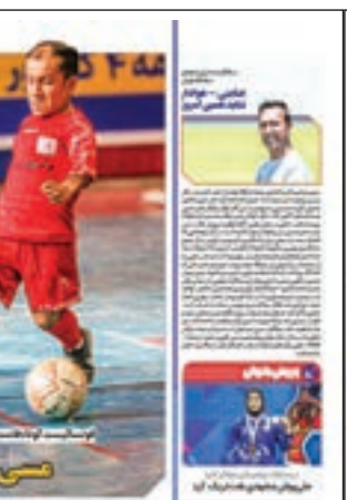
طبیعی؛ طارمی فوتبال پرتغال