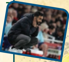
ادامه از صفحه قبل

منچستر یونایتد، غول بلامنزاع فوتبال انگلیس، پس از فرگوسن دیگر خودش را باخته است. البته این روزها شکست های سریالی شیاطین سرخ را در سیاهی کامل فرو برده است. شکست ۳-۱ مقابل برایتون نه فقط یک باخت ساده، بلکه تکرار آساری هولناک از فصل ۱۸۹۳ بود؛ شکستی که غرور شیاطین سرخ را به خاک مالید. اولد ترافورد، قلعه ای که زمانی شکست ناپذیر بود، حالا شاهد ششمین شکست خانگی فصل است! آماري که حتی روبن اموریم، سرمربی تیم، را به اعترافی تلخ واداشت: «شاید ما بدترین تیم تاریخ یونایتد باشیم.» واکنش ها در شبکه های اجتماعی آتشین است؛ از تمسخر هواداران لیورپول که وضعیت فرمزهای منچستر را دست مایه شوخی های خود کرده اند تا خشم و ناامیدی طرف داران یونایتد. در این میان اوانانا، دروازه بان این تیم، به هدف اصلی انتقادات تبدیل شده است. آیا یونایتد می تواند از این بحران جان سالم به در ببرد یا این سقوط آزاد ادامه خواهد یافت؟ آیا شیاطین سرخ می توانند از خواب سنگین بیدار شوند؟