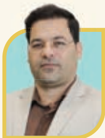
شهردار منطقه ۵ از افتتاح پایانه اتوبوس رانی مفتاح شرقی خبر داد

طی این اقدام، بیست تا از این واحدها و انبارهای غیرمجاز شامل پنج انبار نگهداری غیرمجاز دام، هشت واحد انبار غیرمجاز ضایعات، چهار واحد کارگاه غیرمجاز، دو واحد انبار غیرمجاز مصالح ساختمانی و یک انبار مسکونی ضایعات در محدوده محله های مهدی آباد، نیزه، مهدی آباد پلمب شد.