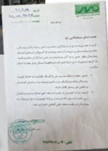
نامه مدیرت بیمارستان خطاب به هیئت امنای مسجد بعد از تجمع مقابل بیمارستان مورخ ۹۸/۹/۲۸