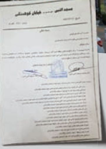
نامه هیئت امنای مسجد به نمایندگی ولی فقیه در مشهد در مورخ ۱۳۹۶/۴/۱۸