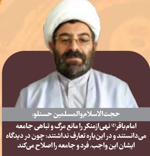
حجت‌الاسلام والمسلمین حسنلو:

سیره حضرت باقرالعلوم (ع) سرشار از الگوهای اخلاقی است که مرور و تبیین آن‌ها، بسیاری از گره‌های رفتاری و اخلاقی را بازمی‌کند؛ این شهرآشوب در کتاب مناقب درباره امام باقر (ع) می‌نویسد: «او را ستوگرتین و گشاده‌روترین و بخشنده‌ترین مردمان بود. در میان اهل بیت (ع) کمترین ثروت را داشت و در عین حال بیشترین هزینه را صرف می‌کرد؛ هر جمعه یک دینار صدقه می‌داد و می‌فرمود: «صدقه روز جمعه به خاطر فضیلت یک روز بر دیگر روزها، دوچندان می‌شود.» هرگاه پیشامدی غم‌انگیز به او روی می‌کرد، زنان و کودکان را جمع می‌کرد، خود دعا می‌کرد و آنان آمین می‌گفتند. بسیار ذکر خدایم‌گفت، راه می‌رفت درحالی‌که ذکر خدا می‌گفت، غذای خورده، با مردم سخن می‌گفت، باز از ذکر خداوند غافل نمی‌شد. فرزندانش را جمع می‌کرد و به آنان می‌فرمود تا طلوع آفتاب ذکر بگویند.»