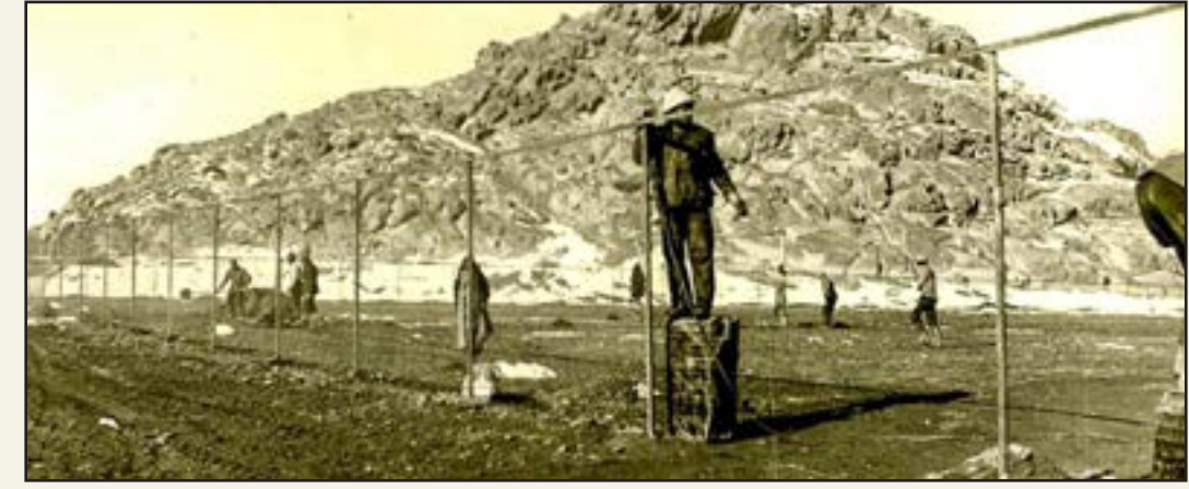
بوستان کوهسنگی در حال احیای (دهه ۴۰ قبل از خورشیدی)

کوهسنگی تاریخی به‌اندازه بینالود دارد و در صد سال اخیر تفرجگاه مردم بوده است. در دهه ۴۰ این بوستان فرسوده و نازیبا شده بود و نیاز به احیا داشت. شهرستانی این کار را نیز بر عهده می‌گیرد و کار توسعه و تزئین و ساخت پارکینگ آن را شروع می‌کند. این بوستان در یک مهرماه سال ۱۳۴۴ افتتاح می‌شود و جراید درباره آن می‌نویسند: «از طرف شهرداری مجلس جشنی در محل عمارت کوهسنگی بر پا گردید و رسماً این محل... گشایش یافت.»