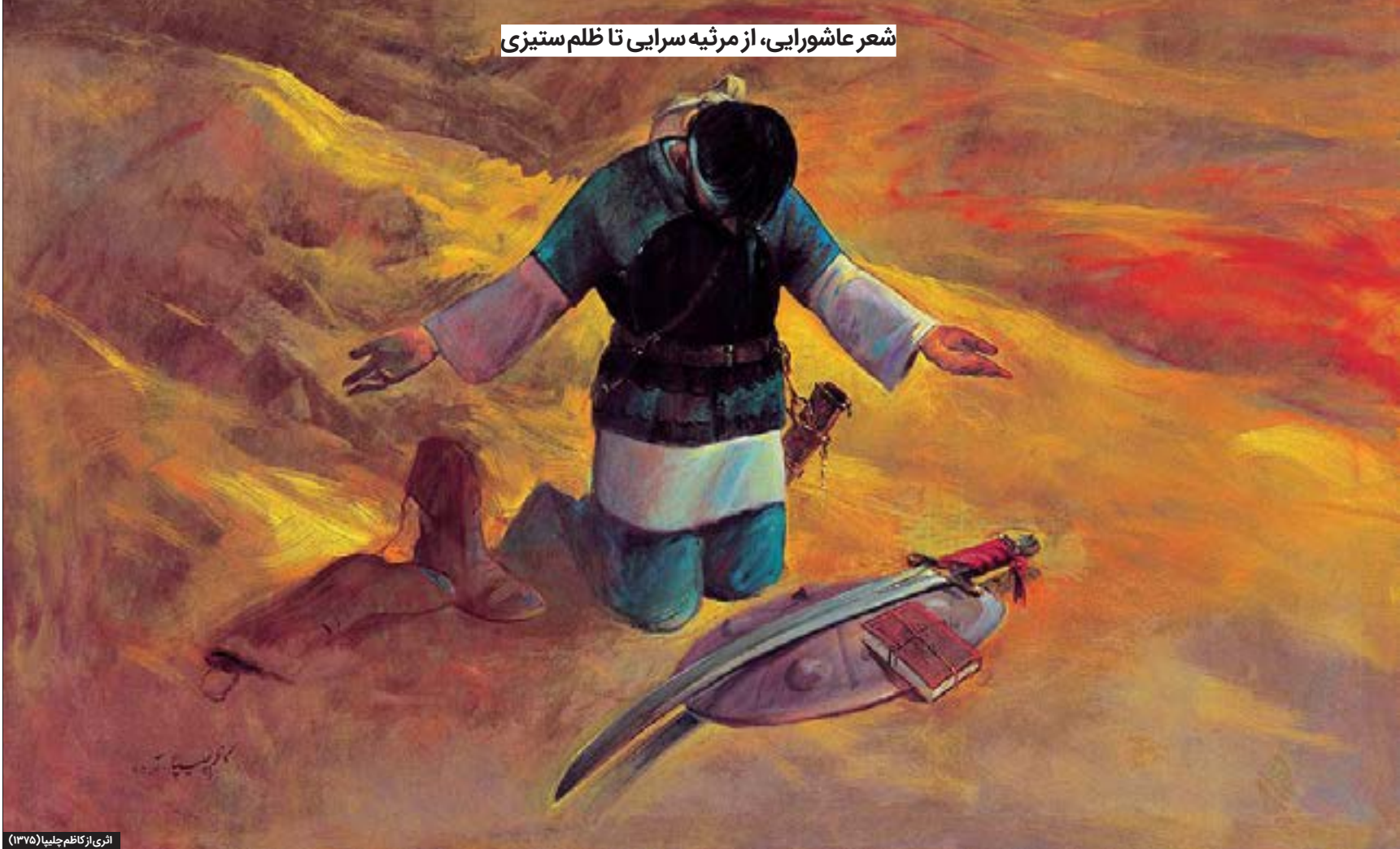
آثاری از کاظم‌علی (۱۳۷۵)

شعر عاشورایی، از مرثیه‌سرایی تا ظلم‌ستیزی