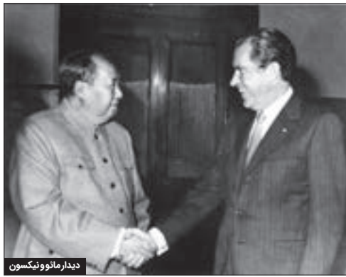
دیدار مائو و نیکسون

بعضی‌ها، وقتی با یک کبک پرخامه رویه رو می‌شوند. همان اول کار، می‌روند سراغ خامه‌های چرب و چیلی روی آن که برایشان از هر چیزی لذیذتر است. من هم در معرفی کتابی که برای امروز برگزیده‌ام، بدون هیچ آداب و ترتیبی، بیشتر بر بخش‌هایی از آن تمرکز کرده‌ام که برای خودم جذاب‌تر بوده‌اند. کتاب «یادداشت‌هایی در باب چین»، نوشته باربارا تاکنم (۱۹۱۲-۱۹۸۹)، مجموعه‌ای از مشاهدات و تأملات این مورخ برجسته آمریکایی است. در سفر شش هفته‌ای اش به چین در سال ۱۹۷۲، یعنی بلافاصله پس از سفر ریچارد نیکسون به آنجا که نخستین سفر یک رئیس‌جمهور ایالات متحده به کشور دشمن بود. تاکنم، برنده جایزه پولیتزر که بیشتر به واسطه آثار تاریخی خود در مورد جنگ‌های جهانی اول و دوم شناخته می‌شود، در این کتاب غیرداستانی، با نگاهی منحصربه‌فرد و تیزبینانه، تصویری ارائه می‌دهد از زندگی روستایی و شهری چین، در طول انقلاب فرهنگی دوران مائو تسه تونگ (رئیس کمیته مرکزی حزب کمونیست چین)، تحولاتی که از ۱۹۶۶ تا ۱۹۷۶، یعنی آخرین سال حیات مائو، طول کشید. این کتاب یکی از اولین آثاری است که یک غربی درباره چین پس از دودمان چینگ (۱۶۴۴-۱۹۱۲) نوشته است.