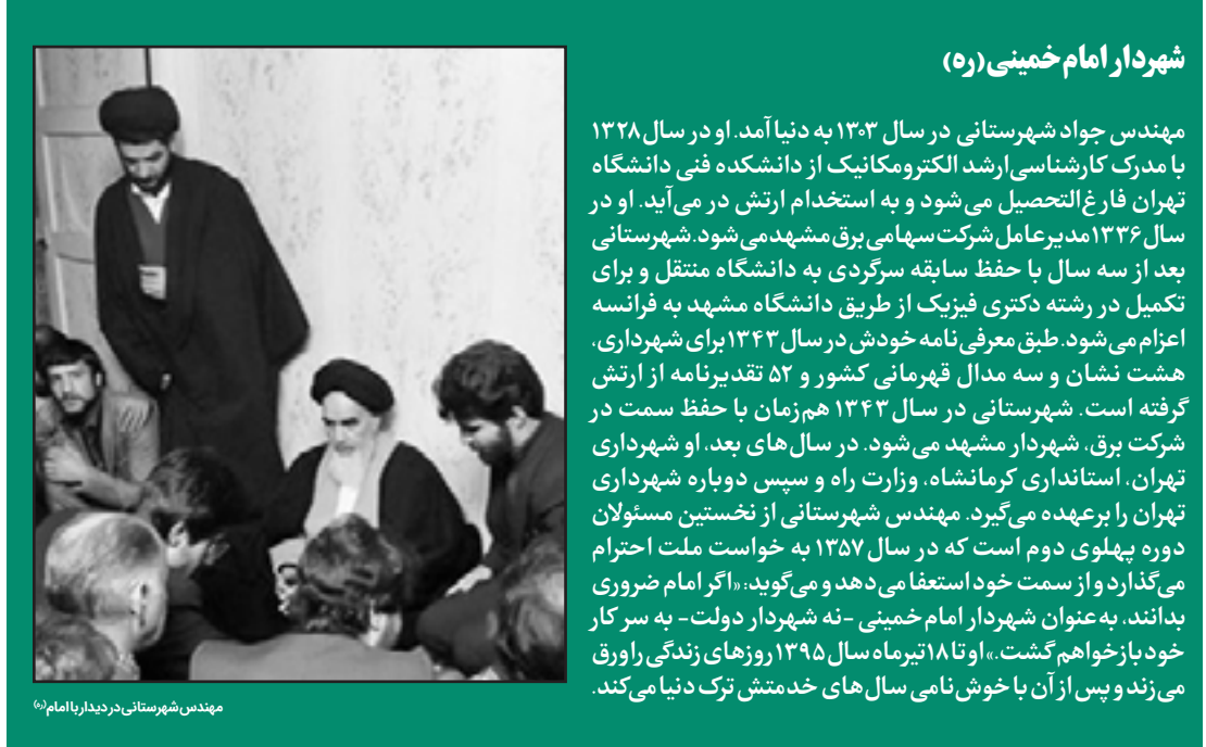
شهردار امام خمینی (ره)

البته باید بدانید بسیاری از کارهای او در زمان خدمتش، اکنون جزو وظایف ذاتی شهرداری محسوب نمی‌شود. او همچنین نقش شهرداری را در کارهای خیر پر رنگ کرد و توانست با بیوغ خودش در آن زمان مدیریتتی جامع برای شهر به‌وجود بیاورد.