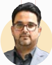
دیوان عدالت اداری مرجع تنظیم خواهی مردم نسبت به دستگاه های عمومی و دولتی است و اگر شهروندی به عملکرد دستگاه های دولتی و عمومی اعتراض داشت، می تواند به این دیوان شکایت کند

که در آنجا هیئت حل اختلافی پیش بینی شده که متشکل از نماینده شهرداری، عضو شورای شهر، نماینده دادگستری و نماینده فرمانداری است. این هیئت وظیفه دارد اختلافات بین شهرداری و پیمانکاران را رسیدگی کند و کل این دبیرخانه یک مرجع شبه قضایی محسوب می شود و پیمانکاران اگر نسبت به عملکرد شهرداری ایهام و سؤال و شکایتی دارند به این کمیسیون مراجعه می کنند. این کمیسیون دو شعبه دارد و هر کدام از شعب یک روز در هفته تشکیل جلسه می دهند و چهار پرونده در هر شعبه رسیدگی می شود. متأسفانه این کمیسیون به دلیل برخی مشکلات مالی بسیار شلوغ است و عمده مراجعه پیمانکاران برای دریافت مطالباتشان است.