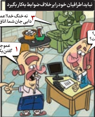
نباید اطرافیان خود را برخلاف ضوابط به کار بگیرد