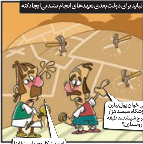
نباید برای دولت بعدی تعهد های انجام نشدنی ایجاد کنه