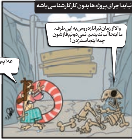
نباید اجرای پروژه ها بدون کارشناسی باشه