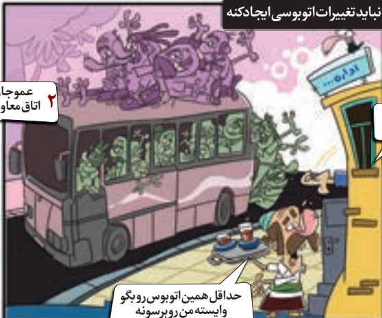
نباید تغییرات اتوبوسی ایجاد کنه