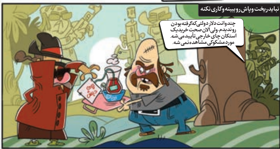
نباید ریخت و پاش رو بیینه و کاری نکنه