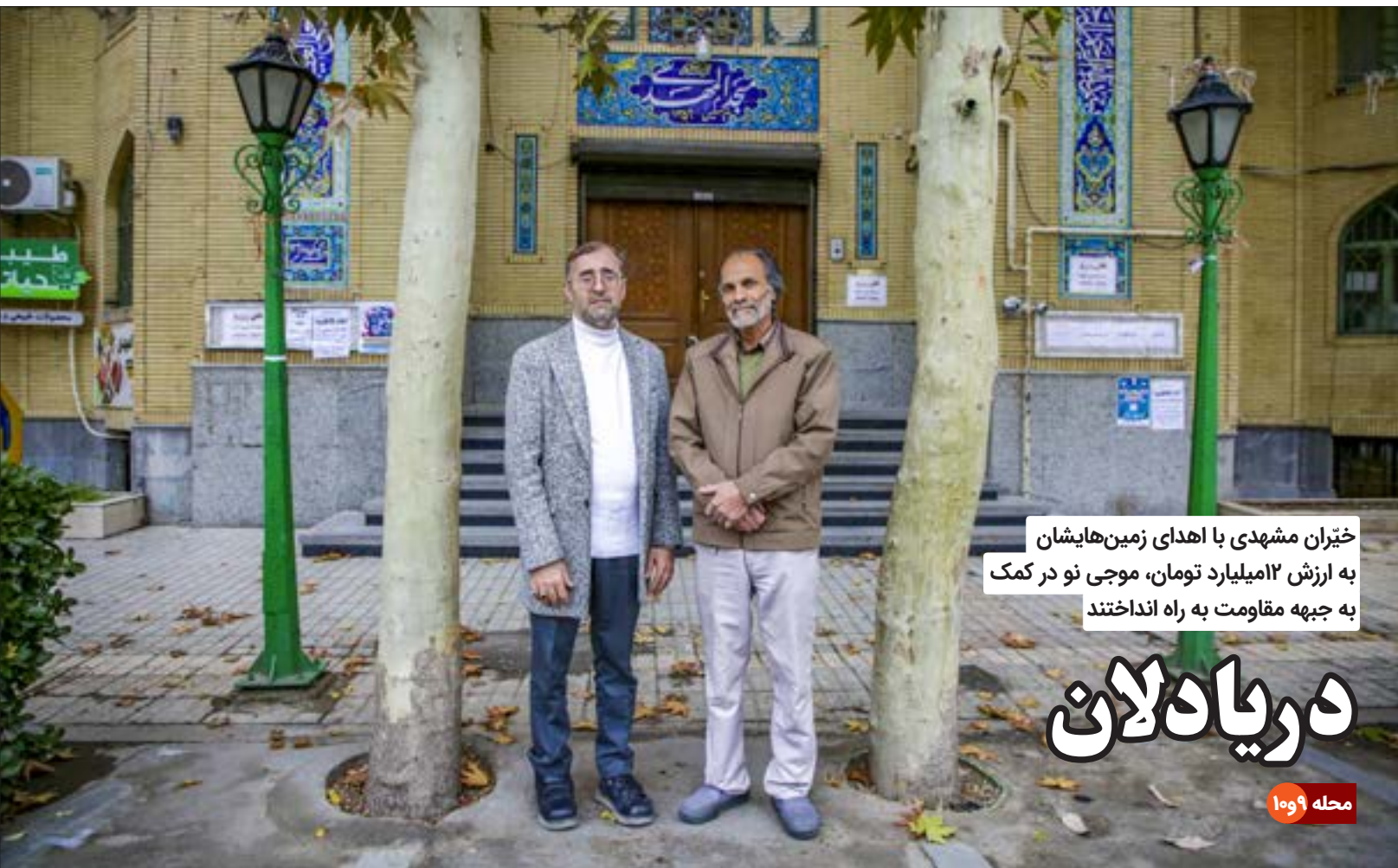
خیران مشهدی با اهدای زمین‌هایشان به ارزش ۱۲ میلیارد تومان، موجی نو در کمک به جبهه مقاومت به راه انداختند

نسل جدید چه تأثیری بر بازار کار گذاشته است؟