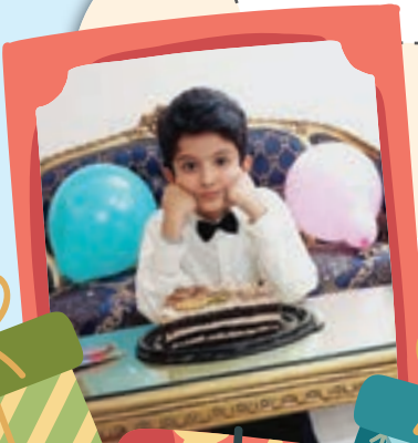
دست همه درد نکنه چقدر زحمت کشیدن و برام چقدر هدیه آوردن.