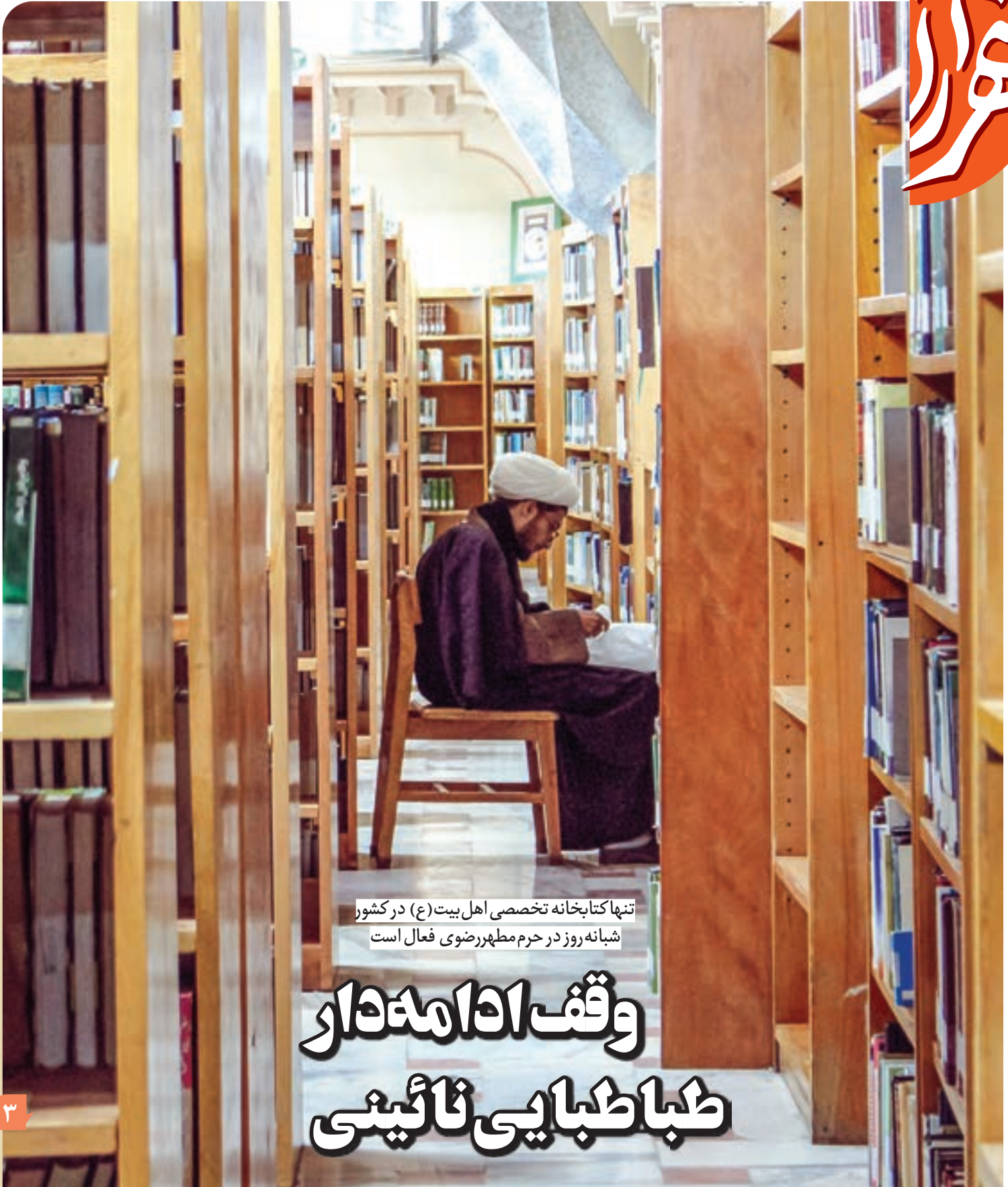
تنها کتابخانه تخصصی اهل بیت (ع) در کشور شبانه روز در حرم مطهر رضوی فعال است