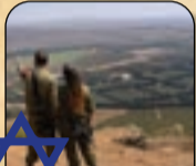
۱۹۶۷ اشغال بلندی های جولان