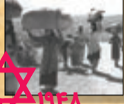
۱۹۴۸ اشغال رسمی کشور فلسطین

رژیم صهیونیستی از ابتدای شکل گیری خود، سیاست توسعه طلبی و تصرف اراضی دیگران را در پیش گرفته است. این رویکرد با اشغال سرزمین تاریخی فلسطین آغاز شد و در سال های بعد نیز با توسعه دامنه تصرفات در مناطق مختلف ادامه یافت.