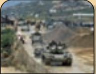
۲۰۰۵ اشغال مناطق جنوب سوریه