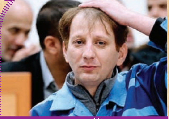
بازگشت نام بایک زنجانی به صدر اخبار

شهرداری مشهد با هدف ایجاد نشاط و جذب گردشگر، بازی‌های کابلی متنوعی از جمله منوریل، زیپ‌لاین، کابل‌گاید و دوچرخه کابلی را در چهار بوستان بزرگ شهر (هفت‌حوض، وکیل‌آباد، چهل‌بازه و کوه‌پارک) راه‌اندازی می‌کند. در بوستان وکیل‌آباد علاوه بر موارد گفته شده، «همستر بایک» نیز به طول ۷۵ متر راه‌اندازی خواهد شد. کوه‌پارک دارای زیپ‌لاین ۷۳۰ متری خواهد بود و چهل‌بازه نیز به زیپ‌لاین ۳۳۰ متری و پل ماجراجویی مجهز می‌شود. در هفت‌حوض نیز زیپ‌لاین دونفره و دوچرخه هوایی نصب می‌شود.