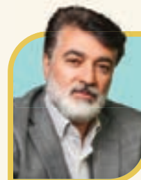
پیام تسلیت شهردار منطقه ۶ درباره حمله تروریستی رژیم صهیونیستی

دشمن بداند که این جنایات، نه ما را متوقف خواهد کرد و نه از مسیر حق عقب خواهد نشاند.