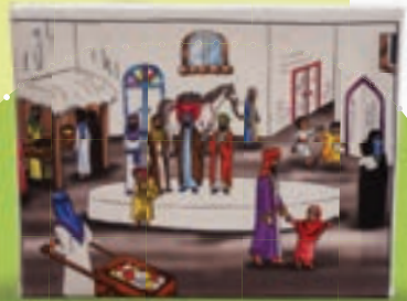
تابلونقاشی برای پرده خوانی

او خاطره‌ای را تعریف می‌کند که منجر به تشکیل گروه تبلیغی‌شان شده است؛ «از سال ۱۳۹۳، روز شهادت حضرت رقیه (س) همایشی برگزار می‌کنیم با نام «غنچه‌های حسینی». اجتماعی که برخی سال‌ها تا پنج هزار نفر هم مخاطب داشته است. سال‌های اول