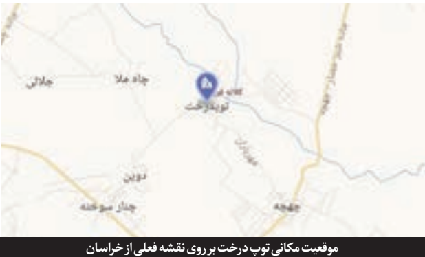
موقعیت مکانی توپ درخت بر روی نقشه فعلی از خراسان

فرخدا به هر گوشه خراسان که چشم بیندازد، تاریخی بلند دارد و شاهدش بناها، آبادی‌ها و هزاران هزار نماد تاریخی و باستانی به یادگارمانده از دوران‌های مختلف است. یکی از این یادگارها تپه «توپ درخت» است که قدمتش را دوران پیش از تاریخ ایران تخمین زده‌اند. این اثر باستانی که مهرماه ۱۳۲۸ با شماره ثبت ۴۰۲۸ به‌عنوان یکی از آثار ملی ایران به ثبت رسیده است، در مجاورت روستایی به همین نام قرار دارد که در نزدیکی مشهد است. سطرهای بعدی گذری است بر پیشینه تپه توپ درخت.