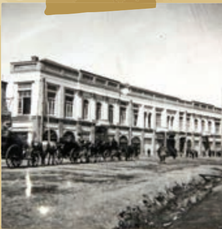
فلکه جنوبی در دوره پهلوی اول