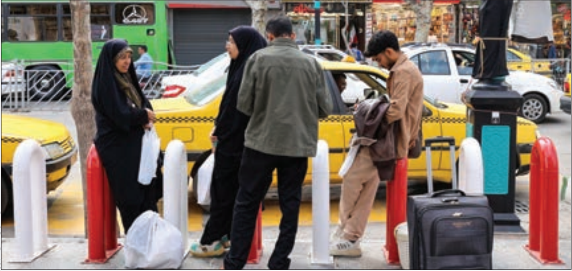
تکمیل زمین های خالی شهرها

● استقبال روزانه ۷ هزار نفر از بارگاه امامزادگان یاسر و ناصر ع