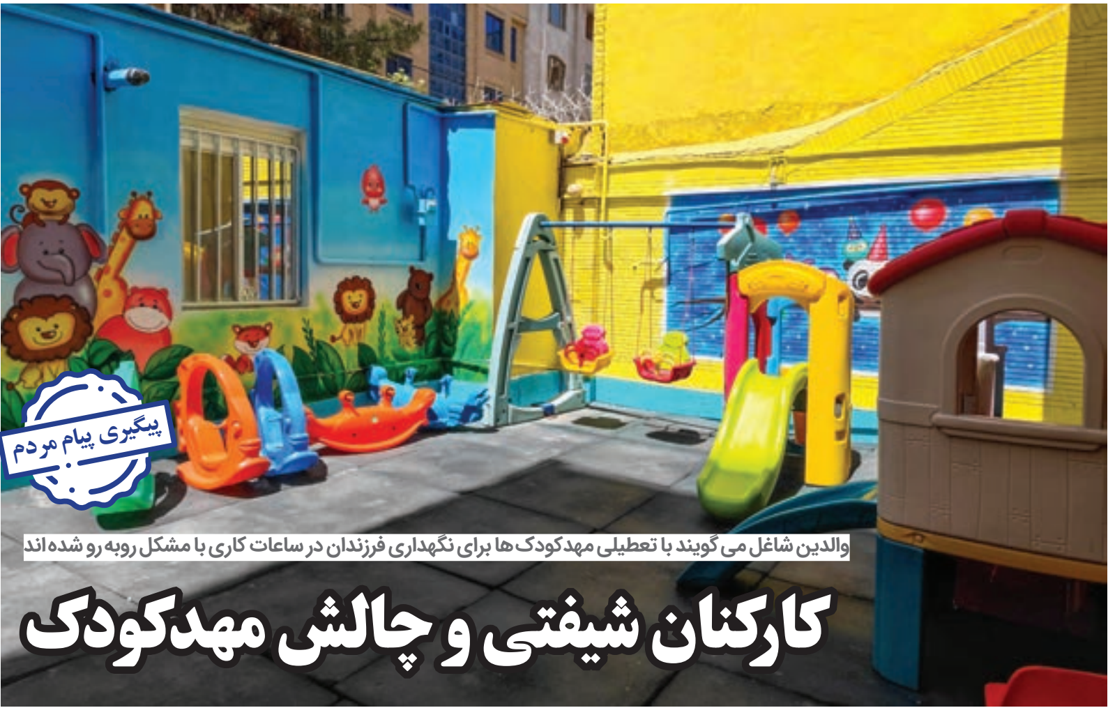
والدین شاغل می‌گویند با تعطیلی مهدکودک‌ها برای نگهداری فرزندان در ساعات کاری با مشکل روبه‌رو شده‌اند