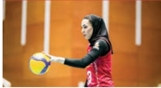
۱۰ روز دیگر نماینده والیبالی ایران راهی تایلند می شود