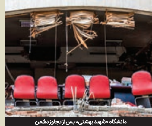
دانشگاه «شهید بهشتی» پس از تجاوز دشمن