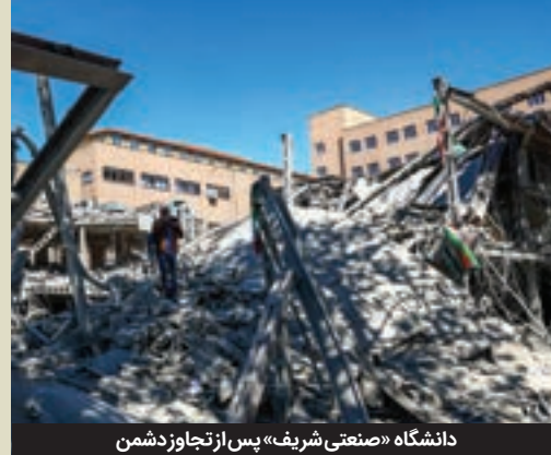
دانشگاه «صنعتی شریف» پس از تجاوز دشمن

تجاوز به دانشگاه های مهم کشور از سوی رژیم آمریکایی-صهیونی بار دیگر ثابت کرد که این جانبران دشمنان واقعی فرهنگ و تمدن ایران اند