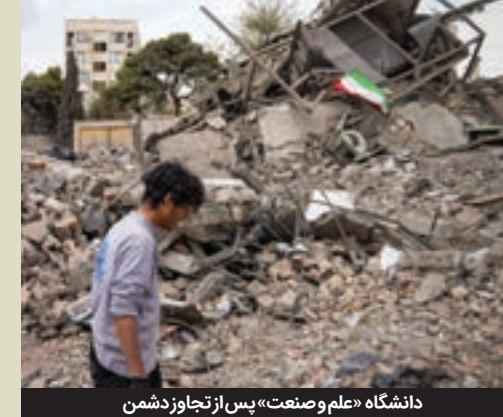
دانشگاه «علم و صنعت» پس از تجاوز دشمن

دانشگاه است که به طور مستقیم هدف حمله موشکی قرار می گیرد. دانشگاه علم و صنعت در یامداد هشتم فروردین ماه، بمباران شد و فردای آن روز دانشگاه صنعتی اصفهان برای بار دوم مورد حمله قرار گرفت. پس از آن، پردیس عباسپور دانشگاه شهید بهشتی که دانشکده های فنی و مهندسی آنجا بود، تخریب شد و حالانویت به دانشگاه صنعتی شریف رسیده است و معلوم نیست تا پایان جنگ، چند بنگاه علمی و پژوهشی دیگر را با جتون خود، از بین می برند.