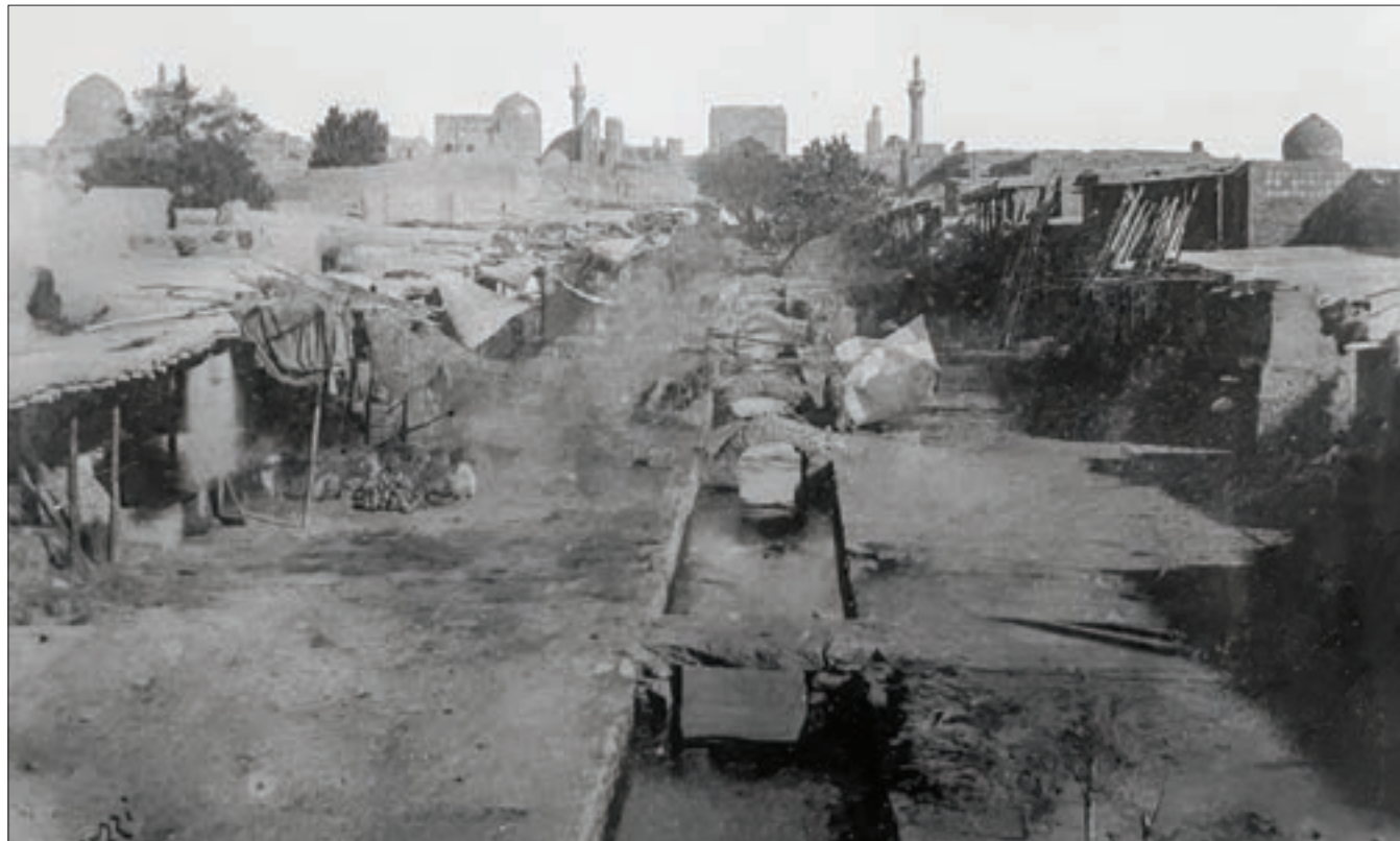
قدیمی‌ترین عکس از مشهد که آنتونی جانوزی از پایین خیابان گرفته است و در مرکز اسناد تاریخ و توسعه شهر شهرداری مشهد موجود است

مرور برخی داشته‌های مرکز اسناد تاریخ و توسعه شهر که تاریخ مشهد را روایت می‌کنند