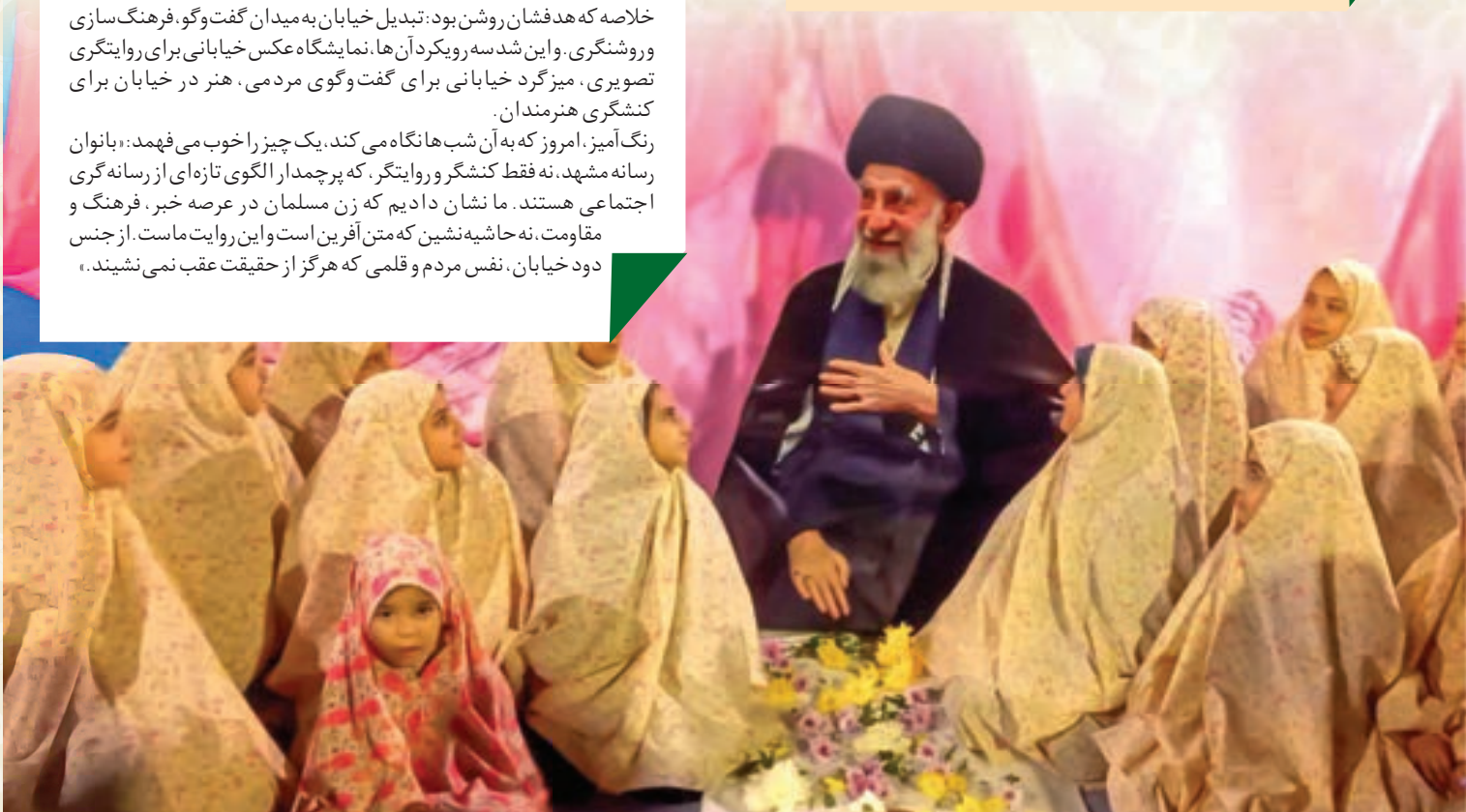
بازسازی تصویر دیدار رهبر شهید با دختران

یکی دو شب اول توان خروج از منزل نداشته، اما از شب سوم که توفیق حضور در «جهاد خیابانی» می یابد، قلبش آرام می گیرد. او نگران خستگی مردم، خلوت شدن خیابان ها در نوروز، و حتی نگران اربعین امام شهید بود، اما بعد به یقین می رسد که: «این امت مبعوث شده، با عنایت الهی راه خود را ادامه می دهد.» باباجانی که دکترای مدیریت رفتار دارد، از تجربه زیستی خود می گوید: «با تمام وجود دست اعجاز الهی را دیدم؛ از همه قشر، سن، گرایش فکری و وظاوری. در ماشین با بچه ها با مشت گره کرده علامت می دهیم. مردم ابتکارهای جالب دارند: پرچم آرای، سیستم های صوتی، موشک هایی که درست می کنند.» خاطره شیرین تری هم دارد: «شب میلاد حضرت معصومه (ع)، مردی را دیدم که به دختران کوچک عروسک صورتی هدیه می داد. افرادی با نیت خالص، با هزینه شخصی پذیرایی می کنند.» اما نکته شگفت انگیز از زبان یک متخصص رفتار این است: «طبق آموخته هایمان، برای تغییر رفتار نیاز به گذشت زمان است. اما این تغییر رفتار مردم ما با علوم امروز کاملاً غیر قابل توجیه است. این همان تربیت امام شهیدمان است و همان مبعوث شدن امت خامنه ای عزیز.»