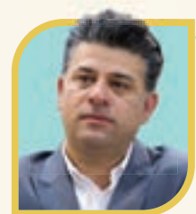
برگزاری ۳۰ دوره آموزشی فشرده «شهروند آماده در زمان بحران» در منطقه ۱۰