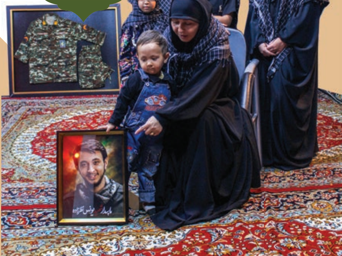
مادر، خواهران و برادرهای یونس در کنار قاب شهید

مادر، از روزی می گوید که پسرش درگوشی در آخرین حضورش گفت: «مامان، می خواهم چیزی بهت بگویم که بهم افتخار کنی. من یک پرنده را زدم.» منظورش پهلوان دشمن بود. مادر می گوید: برای همیشه بهش افتخار می کنم.