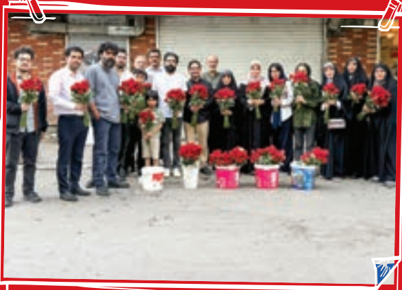
همزمان با ثبت هزارمین ساعت پرچم برافراشته، هزار شاخه گل آماده و به رهگذران اهدا شد