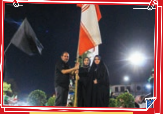
رهگذری پرسید: برای نگه داشتن پرچم چقدر می‌گیرید خانواده بختیاری پاسخ دادند: وطن فروشی نیست

برای همین دوباری که آن را داشتند، یک خودرو کنار پرچم آوردند و روی خودرو ایستادند و همان بالا پرچم را داشتند. یک بار هم وقتی قسمتی از آن پاره شد، همان بالا دوخته شد.