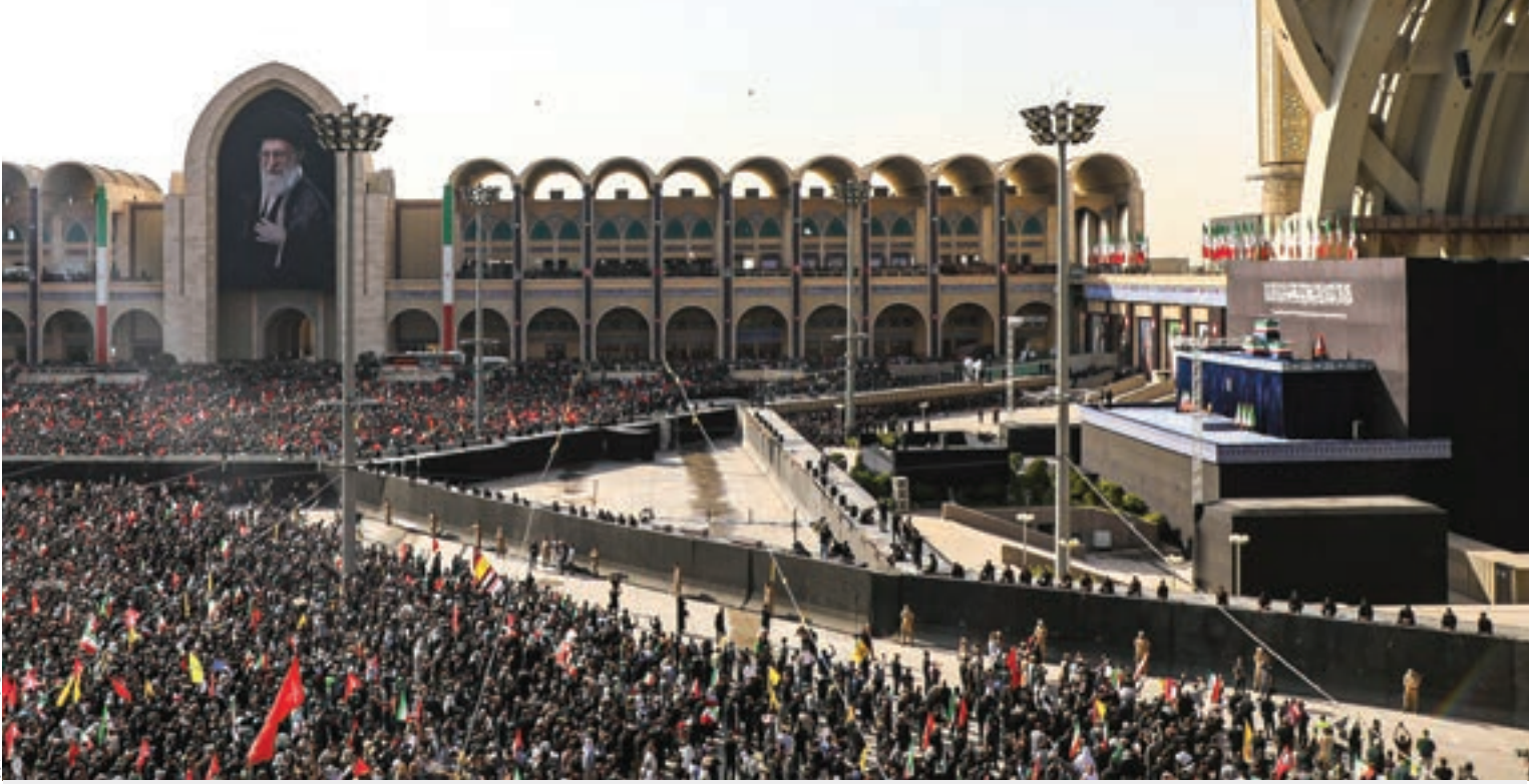
عکس رویدادها شهرآرا