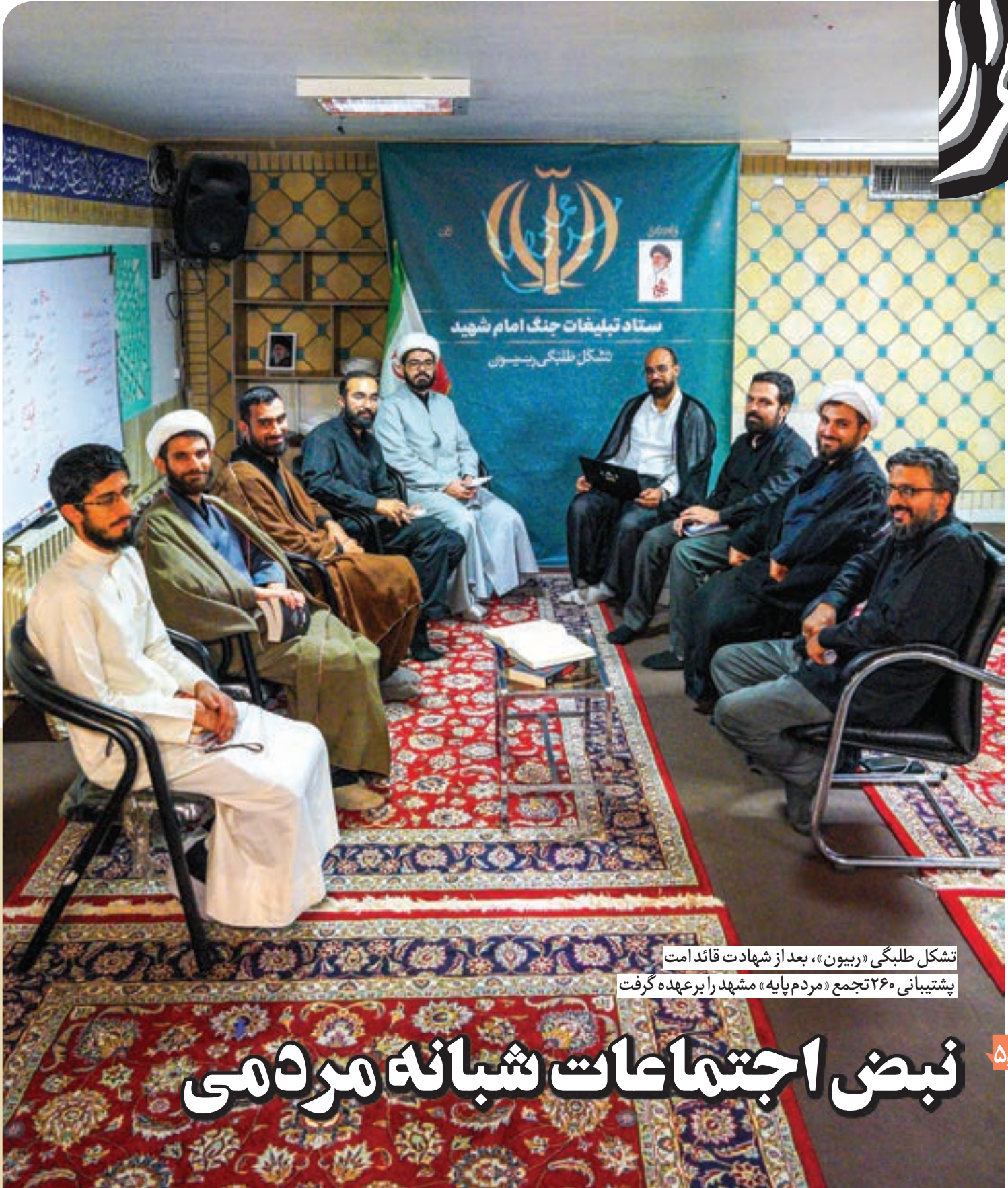
تشکل طلبگی «ریبون»، بعد از شهادت قائد امت پشتیبانی ۲۶۰ تجمع «مردم پایه» مشهد را برعهده گرفت